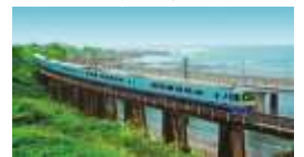
徐行運転 山生(やもめ)橋梁 安房鴨川→