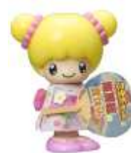
「こえだちゃん」(イメージ)