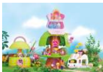
「おもちゃ」(イメージ)