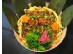
「さんがひつまぶし丼」