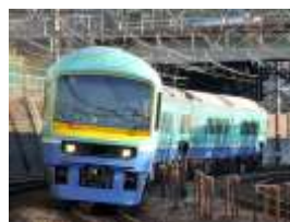
リゾートあわトレイン