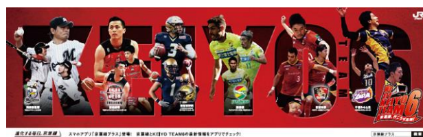
* ラッピングトレイン車内ポスタービジュアル