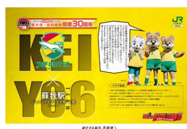
* 新木場～蘇我間開業 30周年 記念列車車内ポスター