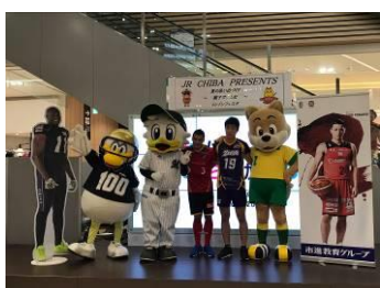
* 2018.8.23 トレインフェスタ @イオンモール幕張新都心