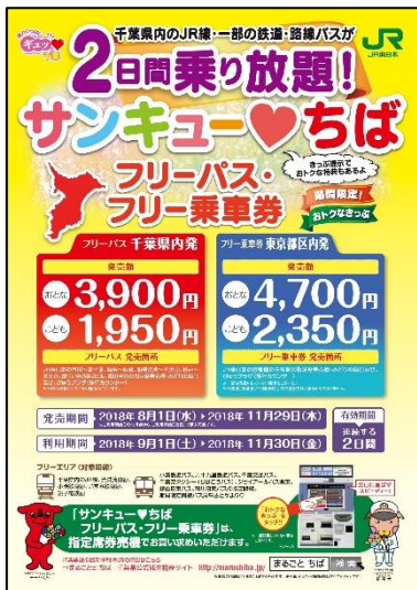
パンフレット表紙