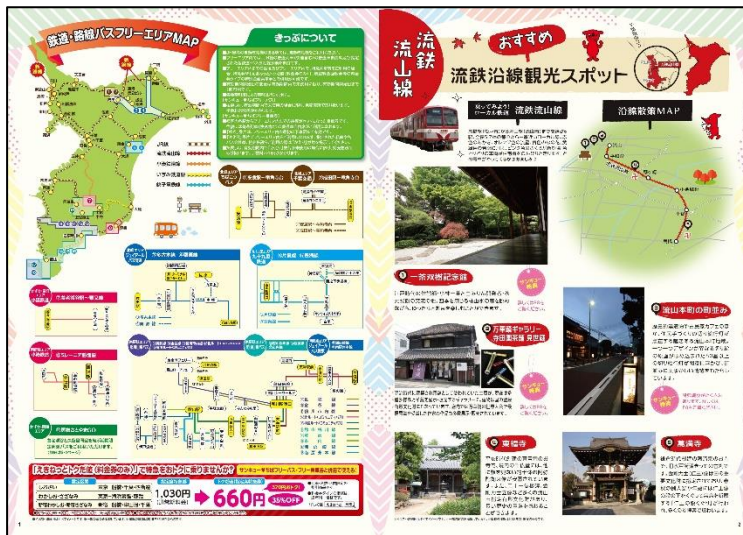
フリーエリアMAP・モデルコース特集ページ