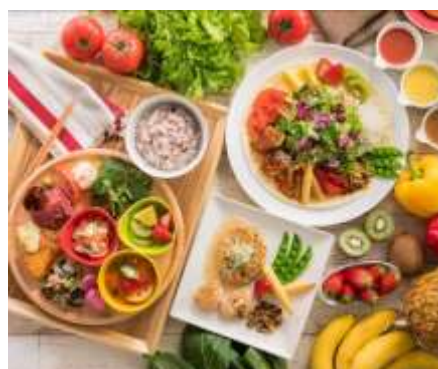
【メニューイメージ】