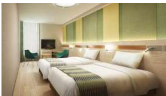
【カジュアル3 イメージ】