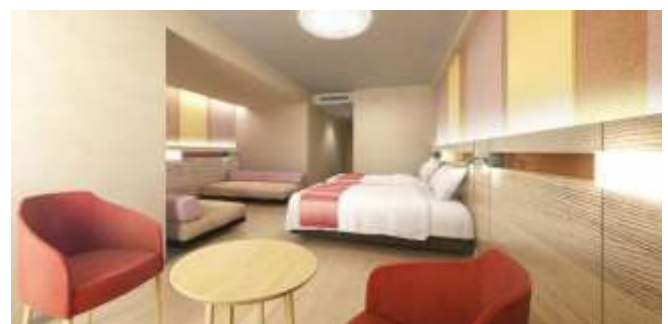
【スーペリア5 イメージ】