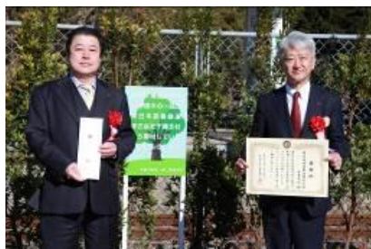
記念寄贈セレモニー