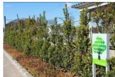
植樹箇所(南口交通広場)