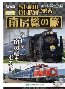
専用パンフレット（イメージ）