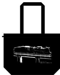
A：オリジナルヘッドマークスタンドと不織布バッグ