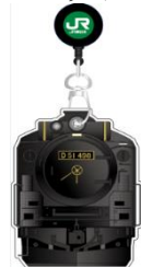
B：オリジナルSLカードケース（伸びるリール付き）