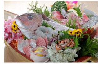
千里の風（夕食の一例）