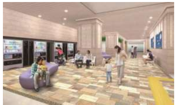
レストスペースイメージ