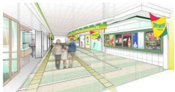
自由通路イメージ