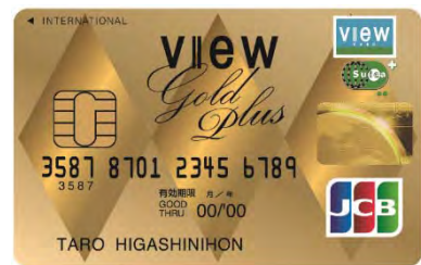
イメージ：ビューゴールドプラスカード