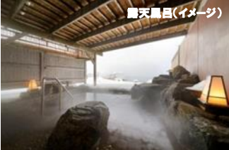
露天風呂(イメージ)