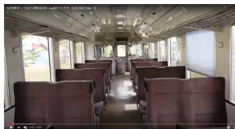
【津軽鉄道動画（イメージ）】

※この他、秋田内陸縦貫鉄道Facebookでは、内陸線クイズやぬり絵、ペーパークラフトなど、お家で楽しめるコンテンツを紹介しています。秋田支社ホームページの特設サイト「んだ！いえてつ！」から、秋田内陸縦貫鉄道コンテンツに直接アクセスできますので、こちらも是非ご覧ください！