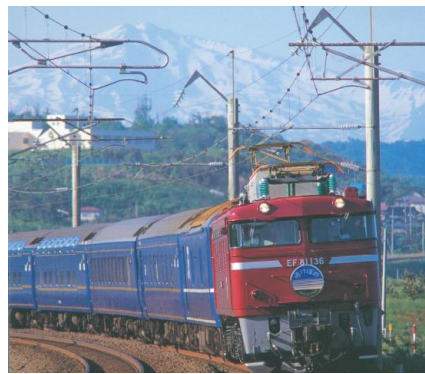
【寝台特急「あけぼの」動画】