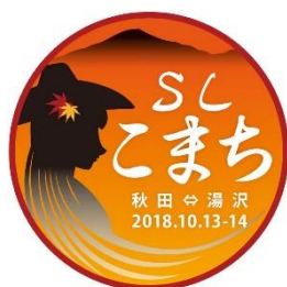
【ヘッドマーク（イメージ）】