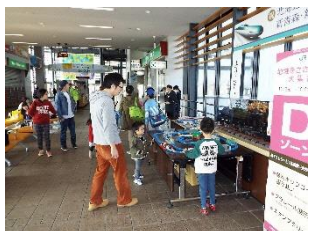
あずましフェスタの様子 （プラレール展示）