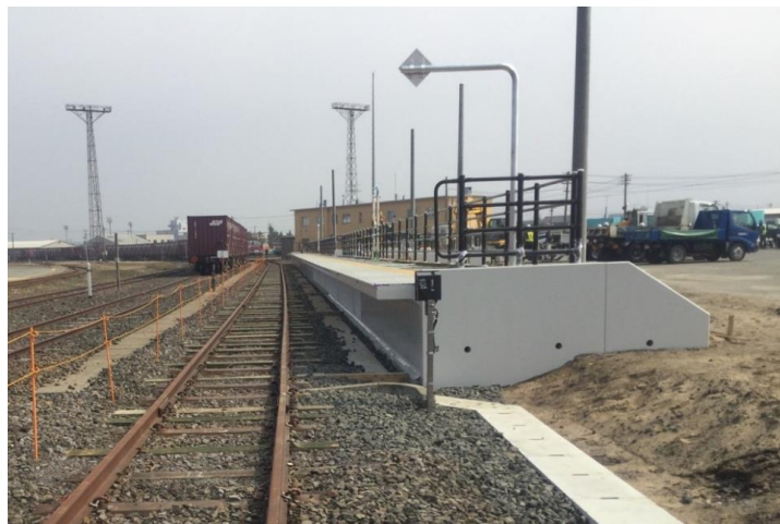
新設した秋田港駅乗降設備