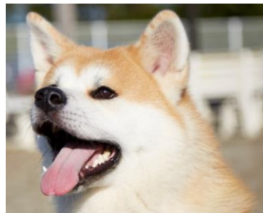
秋田犬サテライトステーション (イメージ)