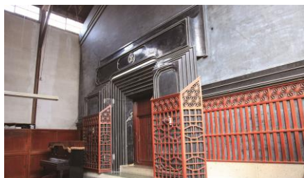
増田の内蔵（十文字駅コース）