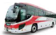
びゅうばす（イメージ）

プラザホテル山麓荘＝駒ヶ岳グランドホテル＝プラザホテル山麓荘別館四季彩＝ ＝田沢湖駅＝抱返り溪谷＝角館自由散策＝安藤醸造 北浦本館＝田沢湖畔（たつこ像）＝湖畔の杜レストランORAE＝山のはちみつ屋＝田沢湖駅＝プラザホテル山麓荘別館四季彩＝駒ヶ岳グランドホテル＝プラザホテル山麓荘