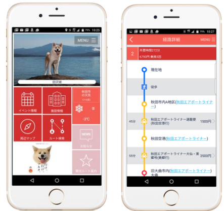
スマートフォンアプリ イメージ