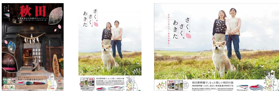
(キャンペーンポスターB1×2種、B0×1種)

JR東日本管内の主要駅でガイドブックや各種ポスター、のぼり旗等の宣伝ツールを掲出し秋田県へのご旅行をご提案します。