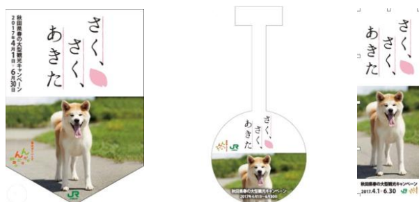
11 (フラッグ・スイングPOP・のぼり旗)