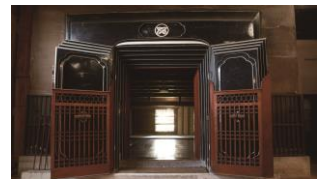
【イメージ】増田の内蔵

十文字駅 == 増田の町並み案内所「ほたる」 == 昼食・自由散策 == 増田の町並み案内所「ほたる」 == 十文字駅