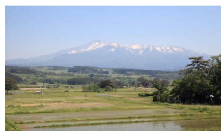
天然記念物「象潟」の九十九島 (象潟駅コース)