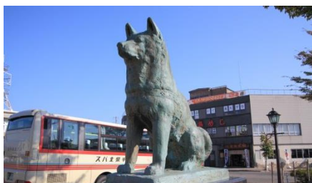
忠犬ハチ公像（大館駅コース）