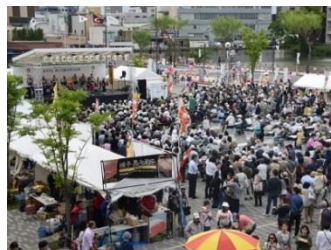
これが秋田だ！食と芸能大祭典