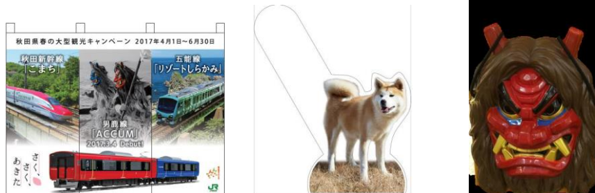
(暖簾・秋田犬アクリルボード・なまはげ面)

JR東日本管内の主なびゅうプラザ店頭では、オリジナル暖簾や秋田犬・なまはげ面をモチーフとした素材を活用して店舗を装飾します。