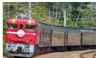
※参考 2015年運転時の「レトロこまち号」