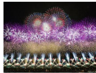
大曲の花火～春の章～