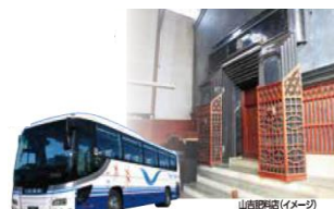
こまち蔵しっく号（イメージ）

増田の内蔵を中心として周辺エリアをめぐるバスプランを設定しました。土曜日コースと日曜日コースで見学内容が異なり、2日間とも増田の町並みを堪能いただくプランとなっています。