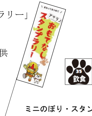
ミニのぼり・スタンプ