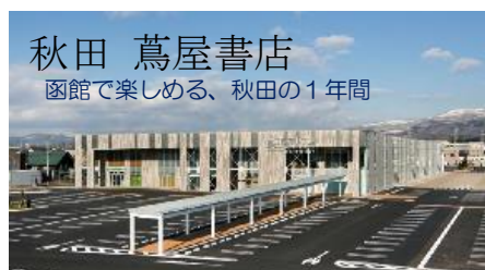
函館観光PRイベント