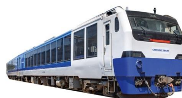
クルージングトレイン

※ 期間中は、男鹿線で交流蓄電池電車「ACCUM」EV-E801系の運転（3月4日営業運転開始予定）や、五能線「リゾートしらかみ」等多くの臨時列車を運転します。