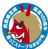
【赤なまはげヘッドマーク】