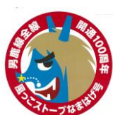
【青なまはげヘッドマーク】