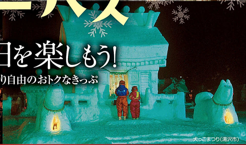
犬っこまつり(湯沢市)

フリーエリア内のJR線のほか、秋田内陸縦貫鉄道全線・由利高原鉄道全線の 普通列車(快速含む)普通車自由席が乗り降り自由!