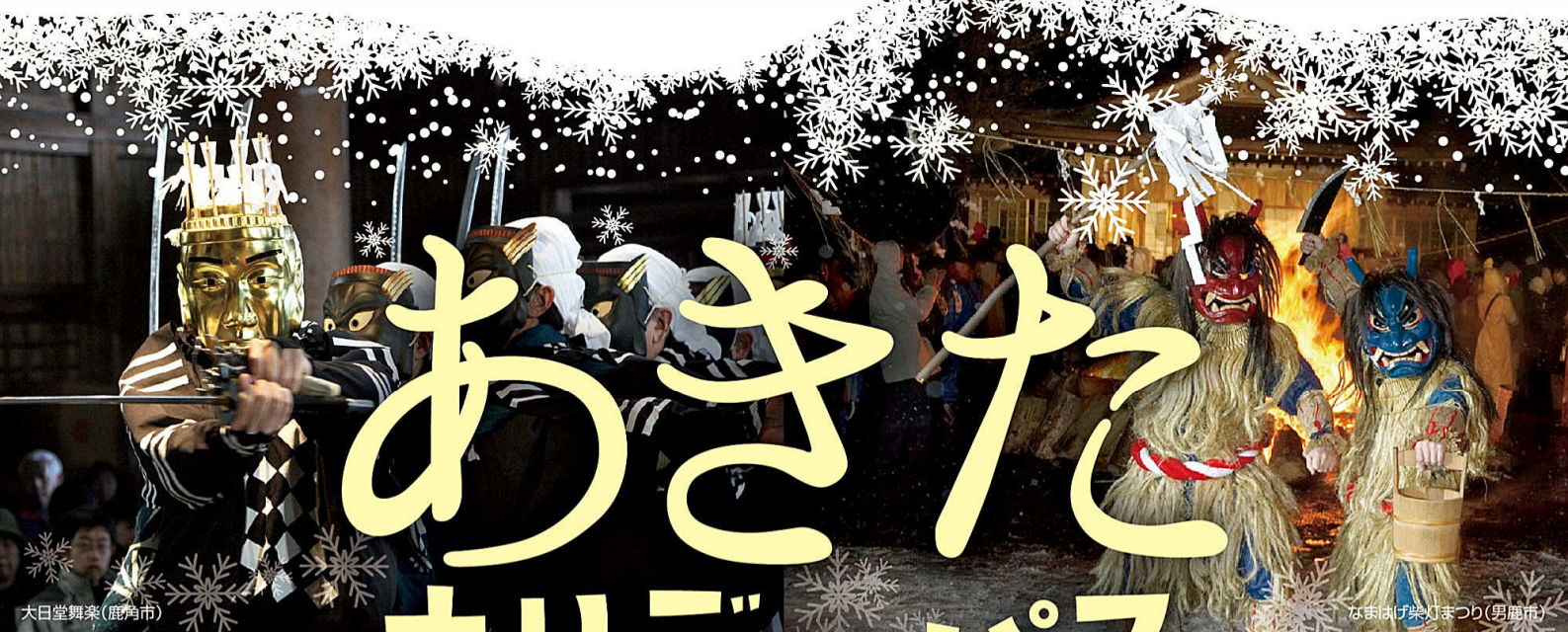
大日堂舞楽(鹿角市)