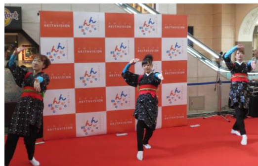
角館お山ばやし手踊り