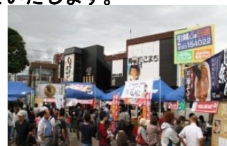
過去の開催の様子（大曲駅）