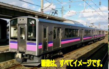
画像は、すべてイメージです。