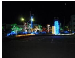
《イルミネーションイメージ》