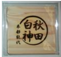
《木製コースターイメージ》