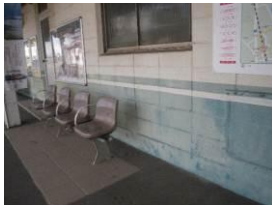
《菖蒲の花を描く前の駅の壁》