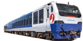
ゆきんこつがる号 （クルージングトレイン）