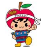
五所川原市キャラクター 「ごしょりん」