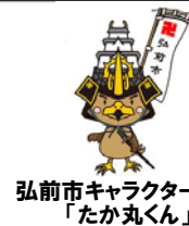
弘前市キャラクター 「たか丸くん」