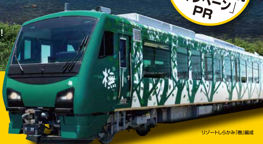
リゾートしらかみ「檜」編成

日本海と白神山地の麓を駆け抜ける五能線!! 乗ってみたいリゾート列車として大人気の リゾートしらかみが登場!