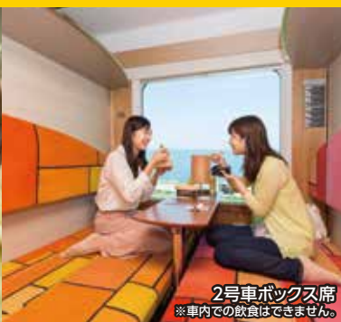
2号車ボックス席 ※車内での飲食はできません。