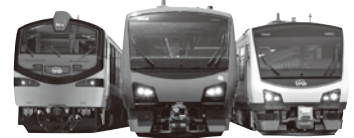
「くまげら」編成・「樺」編成・「青池」編成の3編成