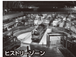
ヒストリーゾーン