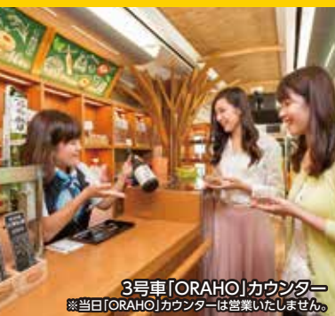
3号車「ORAHO」カウンター ※当日「ORAHO」カウンターは営業いたしません。

先着2,000名様に リゾートしらかみ「檜」編成 オリジナル缶バッジを プレゼント!