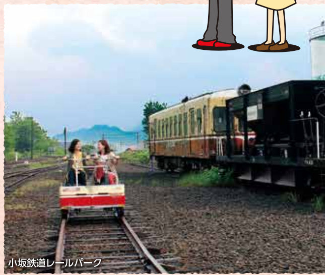
小坂鉄道レールパーク