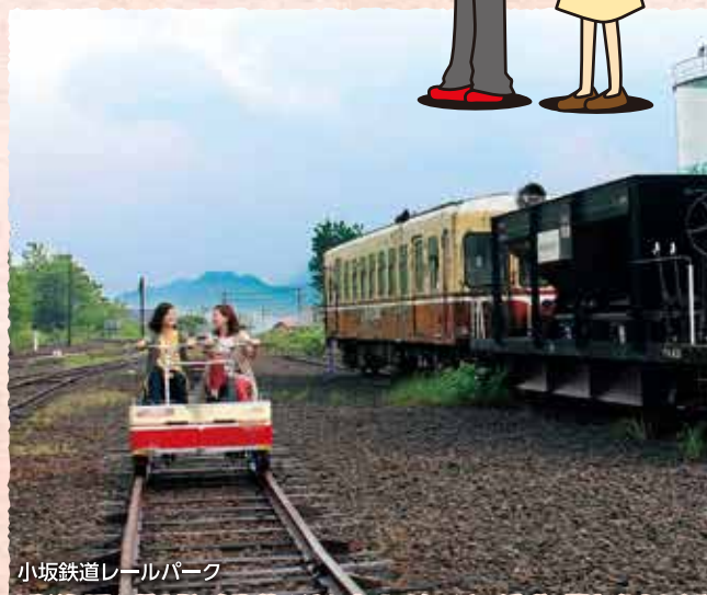
小坂鉄道レールパーク