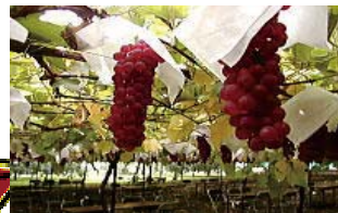
ぶどう狩り (イメージ)