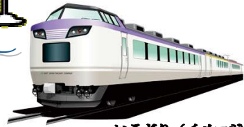
いろどり (イメージ)