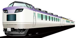
いろどり(イメージ)