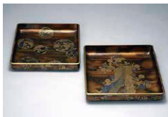
広蓋 三代藩主・真田幸道正室所用

昨年話題となった真田家。信州デスティネーションキャンペーン期間中は、真田信之・信繁ゆかりの品を通して真田家の兄弟や家族の絆を感じられる特別展示を開催いたします。