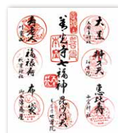
善光寺七福神めぐり

仁王門から北の石畳の参道沿いには、お土産品や民芸、雑貨を扱う店から蕎麦屋やカフェなどの食事処が軒を並べる。善光寺参拝前後の観光客で昔も今も変わらずにぎわいを見せる。