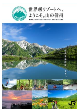
総合パンフレット（A4サイズ）