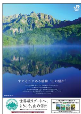
キャンペーンポスター（B1サイズ）

首都圏の主な駅や長野支社管内の駅で、夏の観光キャンペーン「信州プレデスティネーションキャンペーン」総合パンフレット、キャンペーンポスターを掲出します。