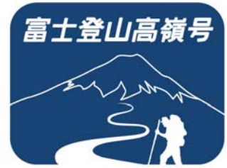
「富士登山高嶺号」ヘッドマーク

上り 河口湖(18:48 発)→立川(20:41 着) 7月4日(土)、11日(土) 〈全車自由席〉