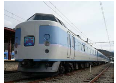
ホリデー快速河口湖号