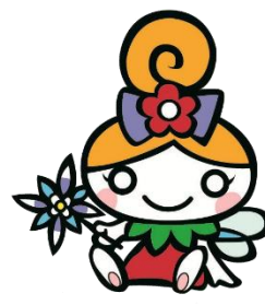
花巻市公認キャラクター 「フラワーロールちゃん」