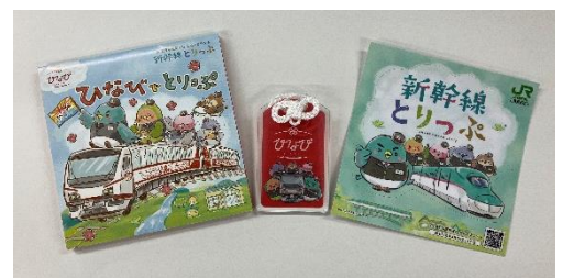
ノベルティ(イメージ)