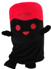
住田町公認キャラクター 「すみっこ」