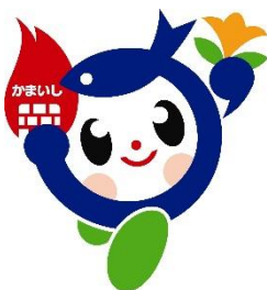
釜石市イメージキャラクター 「かまリン」