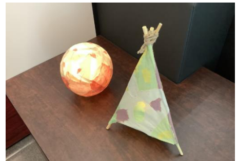
「成島和紙」ランプシェード(イメージ)