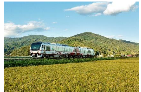
観光列車「ひなび(陽旅)」

また、車両公開中は、花巻市伝統工芸品「成島和紙」ランプシェードで車内を彩ります。