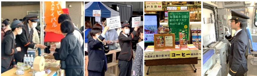
2023 年開催時の当日ご案内・駅告知ブースの様子

車内放送や駅の告知ブース、当日の会場ご案内など、イベントまでの期間、沿線一体で盛り上げます！ぜひお越しください！