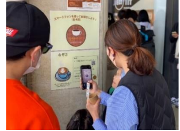
2023 年のラリーの様子

その他、出店店舗の情報、マップなども順次更新予定です。ぜひ「中央線と暮らす」アプリと一緒に、中央線コーヒーフェスティバルをお楽しみください。