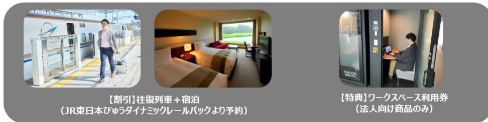
【割引】往復列車+宿泊 (JR東日本びゅうダイナミックレールパックより予約)