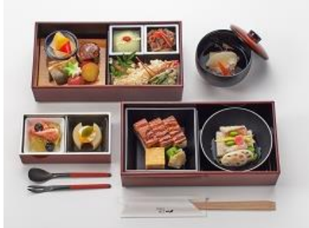
食事メニューの一例